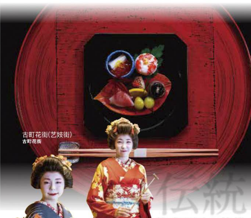
古町花街(艺妓街) 古町花街

雪·温泉 国内屈指可数的滑雪场和温泉 国内屈指のスキー場と温泉 丰富的积雪促使滑雪度假村的发达，滑雪场近处有温泉。 豊富な積雪量からスキーリゾートが発達。スキー場の近隣には温泉もあります。