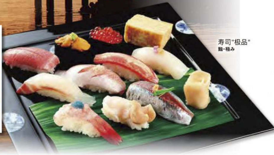
寿司"极品" 鮓・極み