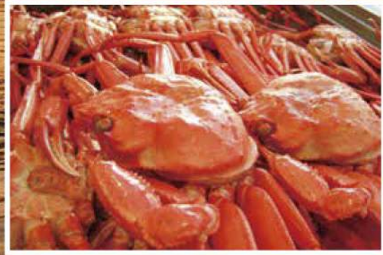
红雪蟹 ベニズワイガニ

从北到南有很长的海岸，许多渔港。可以品尝到丰富新鲜的海鲜料理。 北から南まで海岸線が長く、漁港もたくさん。豊富で新鮮な魚料理が味わえます。