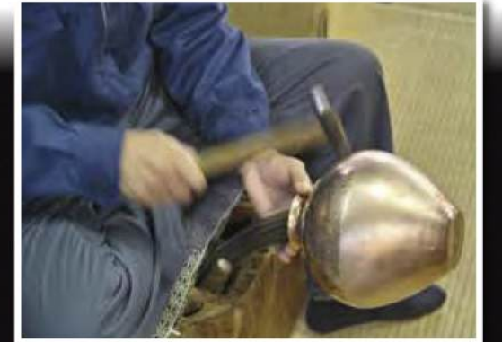
燕三条的金属加工业 燕三条の金属加工業